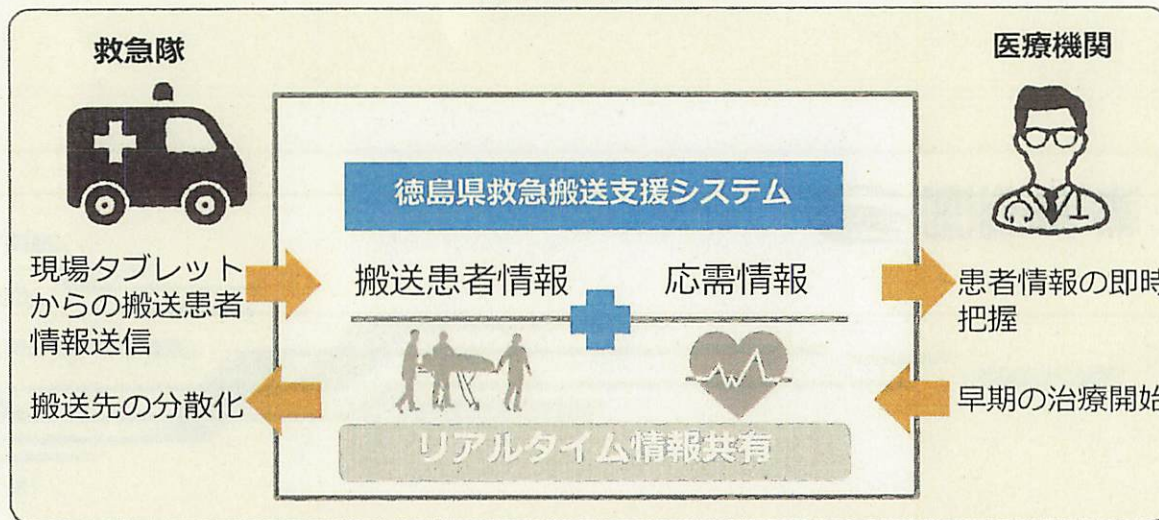
利活用の全体概要イメージ